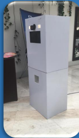
Photo Booth es una aplicación que permite tomar una foto con un marco prediseñado y enviada a su email. Los asistentes al congreso se toman la foto, introducen su email